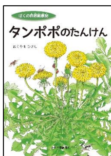
『ほくの自然観察記 タンポポのたんけん』