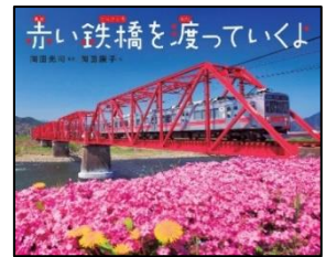
『赤い鉄橋を渡っていくよ』