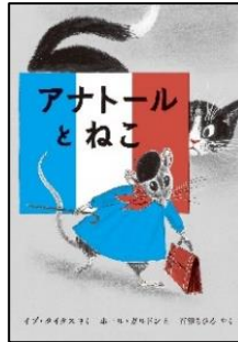
『アナートルとねこ』