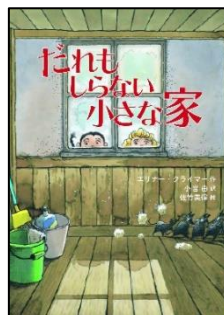
『だれもしらない小さな家』