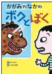
『かがみのなかの ボクとぼく』