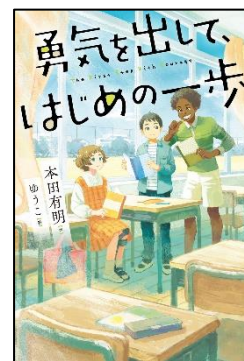
『勇気を出して、はじめての一步 The First Step With Courage』