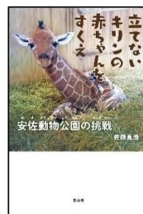
『立てないキリンの赤ちゃんをすくえ 安佐動物公園の挑戦』