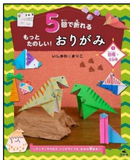
『5回で折れるもったのしい!おりがみ 1 恐竜・古生物』