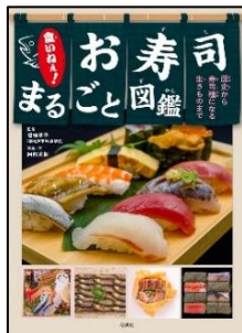
『おいしいお寿司まるごと図鑑 歴史から寿司種になる生きものまで』