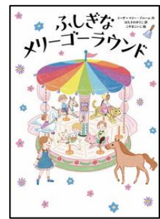
『ふしぎなメリーゴーラウンド』