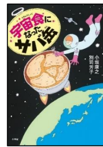
『宇宙食になったサバ缶』