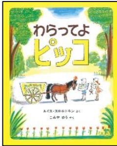
『わらってよピッコ』