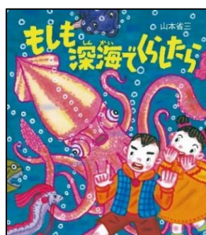
『もしも深海でくらしたら』