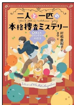
『二人と一匹の本格捜査ミステリー 1 消えたボウリングボールの行方』