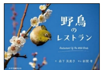
『野鳥のレストラン Restaurant Of The Wild Birds』