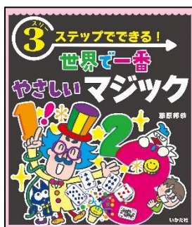
『3ステップでできる! 世界で一番やさしいマジック』