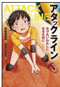
『アタックライン 1 なりたいたいわたしになるために』